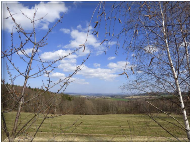
Foto: Jaro na Netvořicku